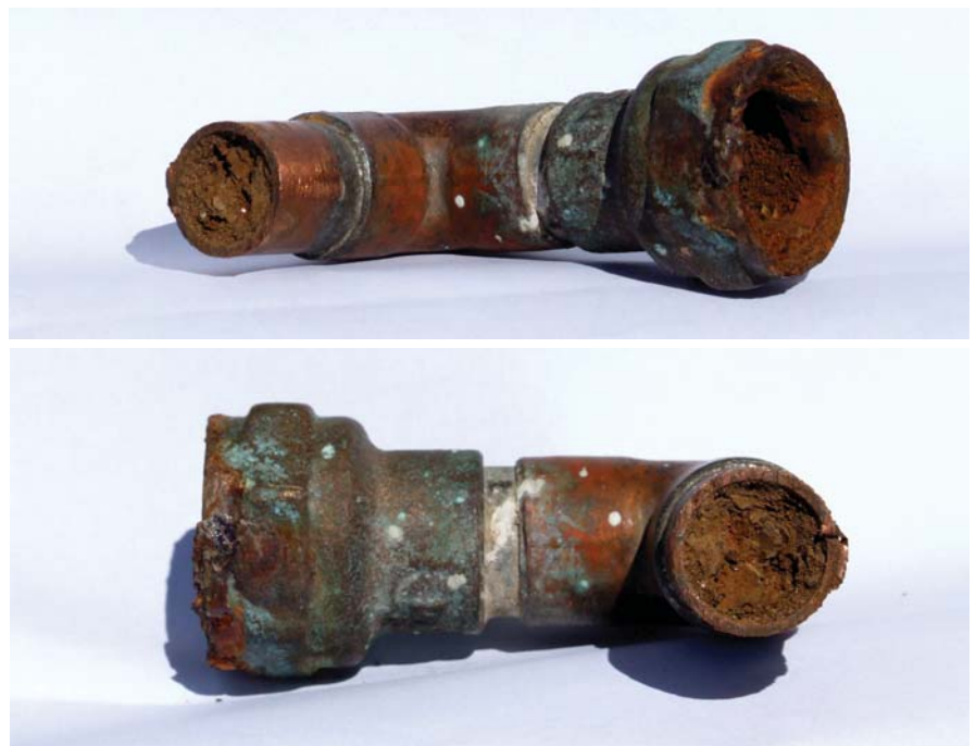
Rys. 11. Skutki zaniedbań w zakresie uzdatniania wody

W Polsce, ze względu na stosunkowo niski koszt procesu, z reguły przeprowadza się dezynfekcję za pomocą chlorowania. Ma to jednak niekiedy katastrofalny wpływ na walory smakowo-zapachowe i zdrowotne wody. Niemniej dezynfekcja drogą chlorowania jest metodą skuteczną. Do przygotowania i dawkowania chloru, a w zasadzie jego roztworu w postaci podchlorynu, służą specjalne pompy dozujące. Z drugiej jednak strony naukowcy z wielu krajów już od dłuższego czasu zwracają uwagę na szkodliwość picia chlorowanej wody. Badania Uniwersytetu Harvarda oraz Medical College of Wisconsin, jak i Cumberland College w New Jersey dowiodły, iż spożywanie chlorowanej wody jest przyczyną problemów kardiologicznych, nowotworów jelit i pęcherza moczowego. Ale nie tylko picie chlorowanej wody stwarza zagrożenie dla zdrowia.