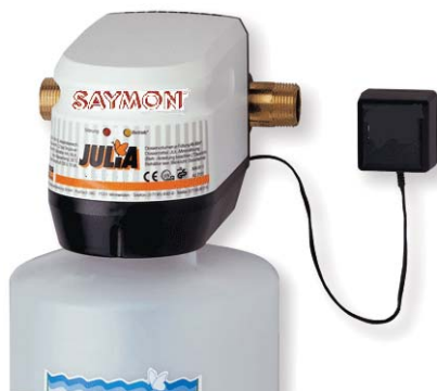
Rys. 7. Zestaw dozujący preparaty uzdatniające wodę

Odżelazianie wody jest procesem szczególnym i polega na jonowymyennym wiązaniu żelaza, albo na reakcji chemicznej, utlenieniu żelaza dwuwartościowego do trójwartościowego i odfiltrowaniu nierozpuszczalnych związków żelaza na specjal-