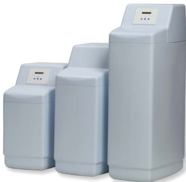
Rys. 6. Zmiękczacze Sentencia firmy Saymon, ze sterowaniem elektronicznym lub elektromechanicznym czterocyklicznym

drodze jonowymiennej lub reakcji chemicznej. Zmiękczenie jonowymienne ma na celu przede wszystkim usunięcie jonów wapnia i magnezu z wody i zastąpienie ich kationami sodu.