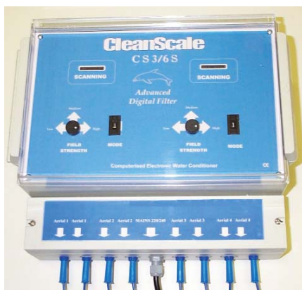
Rys. 3. Elektromagnetyzer indukcyjny Saymon CleanScale

nych. Choć zakupowo są stosunkowo tanie, to koszty eksploatacyjne z biegiem czasu są znaczne. W praktyce często zaniedbuje się regularną kontrolę czystości i wymianę wkładów, co prowadzi do nadmiernego zanieczyszczenia i powtórzonego skażenia wody. Wkłady często stają się również siedliskiem skażenia mikrobiologicznego.