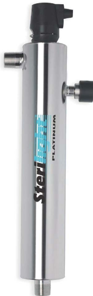
Rys. 8. Lampa UV do uzdatniania wody

Żelazo występuje w wodach podziemnych od ilości śladowych aż do bardzo znacznych rzędu kilkudziesięciu mg/l w postaci rozpuszczonych w wodzie bezbarwnych soli żelaza dwuwartościowego lub jako wytrącony czerwony osad, będący solami żelaza trójwartościowego. Za-