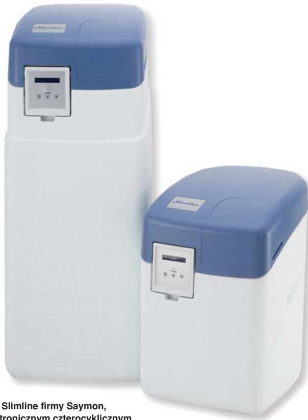
Rys. 5. Zmiękczacze Slimline firmy Saymon, ze sterowaniem elektronicznym czterocyklicznym

Zmiękczacze dostępne są jako kompaktowe urządzenia przeznaczone do pracy okresowej (jednokolumnowe) lub ciągłej (dwo- lub wielokolumnowe), w których podczas regeneracji złoża w jednej kolumnie woda uzdatniana jest poprzez złożo w drugiej kolumnie. Dzięki łączeniu dwóch lub trzech stacji w zestawy możliwa jest elastyczna zmiana wydajności odpowiednio do aktualnych potrzeb. Zastosowanie głowic sterujących wyposażonych w mikroprocesory zapewnia równomierny rozkład obciążenia każdej stacji oraz automatyczne wywoływanie i kontrolę procesu regeneracji. W przypadku metody jonowymiennej najważniejszą rolę ogrywa rodzaj złoża, jego zdolność regeneracyjna i żywotność. Od tego też uzależniona jest cena urządzenia i skuteczność uzdatniania. Złożo syntetyczne CrystalRight pozwala równocześnie zmiękczyć wodę oraz usunąć żelazo i mangan, a także absorbować amon i poprawić barwę i mętność. Niestety nie zawsze możliwe jest zastosowanie tego produktu. Pozostaje wówczas wykorzystanie oddzielnych urządzeń do zmiękczenia, odżelaziania i odmanganiania oraz korekty organoleptycznej.