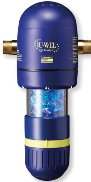
Rys. 10. Saymon Juwel – witalizator mono

Trzecim etapem jest uzdatnianie pod względem mikrobiologicznym. Woda dostępna w środowisku naturalnym zawiera różnego rodzaju zanieczyszczenia organiczne, jest tym samym nosicielem i środowiskiem rozwoju wirusów i bakterii, z których musi zostać oczyszczona do tego stopnia, aby spożywana lub wykorzystywana nie była przyczyną i źródłem powstawania chorób. Proces pozbawienia wody mikroustrojów, bakterii, grzybnii oraz zapewnienia jej czystości mikrobiologicznej powszechnie nazywany jest dezynfekcją wody. Dezynfekcji wymaga praktycznie każda woda, począwszy od wody wykorzystywanej w przemyśle spożywczym, a skończywszy na wodzie w basenach kąpielowych oraz w obiegach chłodniczych i kotłowych. Szczególną uwagę należy jednak przywiązać do dezynfekcji wody bezpośrednio konsumowanej.