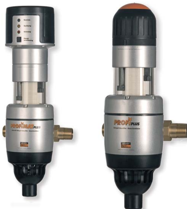
Rys. 1. Filtr samoczyszczący ProfiMat Plus z trójpunktowym odsysającym płukaniem wstecznym i ochroną antybakteryjną – wersja automatyczna z kontrolą oczyszczania, oraz Profi Plus

Woda (H 2 O) z chemicznego punktu widzenia to jedna z najprostszych cząsteczek heteromolekularnych, wykazująca jednak zaskakujące w swojej złożoności zachowania podczas procesów, w których uczestniczy. Cecha ta jest następstwem połączenia atomów o skrajnych właściwościach: Tlen to jeden z najbardziej elektroujemnych pierwiastków. Wodór ma w większości swoich połączeń wyraźny charakter elektrododatni. W konsekwencji właściwości te sprawiają, iż woda wykazuje dużą zdolność rozpuszczania zarówno związków nieorganicznych, jak i organicznych, a także wykazuje właściwości agresywne.