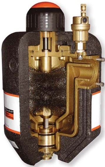
Rys. 2. Filtr Heifi-Vent – samoczyszczący z odzwozywaczem, do instalacji centralnego ogrzewania

Problemy, z jakimi w praktyce spotyka się firma Saymon, dotyczą m.in. już wykonanych inwestycji, które nie spełniają swojego zadania. Nieznajomość pewnych zagadnień i opieranie się wyłącznie na intuicji lub ofertach i materiałach firm sprzedających i instalujących urządzenia prowadzi niekiedy do takich sytuacji. W tych przypadkach często przyczyna tkwiła w niewłaściwej technologii lub w niedo-