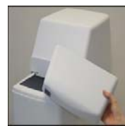
Zdejmowana pokrywa ułatwia zasypanie soli