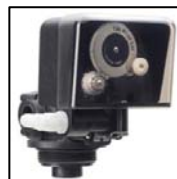
Sterownik zabudowany pod pokrywą

Automatyczne stacje uzdatniania wody działające w oparciu o zjawisko wymiany jonowej mogą być stosowane zarówno w instalacjach domowych, jak i w obiektach użyteczności publicznej, gastronomicznych, hotelowych oraz w zakładach przemysłowych. Obniżenie twardości ogólnej poprzez zatrzymanie jonów wapnia i magnezu na wysokowydajnym złoże pozwala na zastosowanie SUW do celów kotłowych i ochrony urządzeń grzewczych. Akurat podgrzewanie wody intensyfikuje proces wytrącania się twardych osadów (kamienia kotłowego) w rurach, podgrzewaczach, sprzęcie gospodarstwa domowego. Podobne skutki zachodzą też podczas odparowania wody, nawet częściowego, (nawilzacze, filtry powietrza, chłodnie). W takich przypadkach nawet stosunkowo niewielka zawartość substancji tworzących kamień kotłowy może z upływem czasu doprowadzić do poważnych problemów.