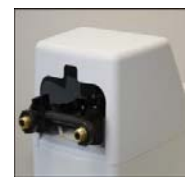
Bypass z zaworem mieszającym (opcja)

Zmiękczacze serii Sentencia wyróżniają się w gamie kompaktowych zmiękczaczy. Klasyczny kwadratowy design i zastosowane rozwiązania techniczne spełniają ponadstandardowe oczekiwania użytkowników. Dostępne są następujące modele: 11 (Mini), 15 (Midi), 20 (Maxi) i 26 (Maxi+) w konfiguracji BudgetPlus.